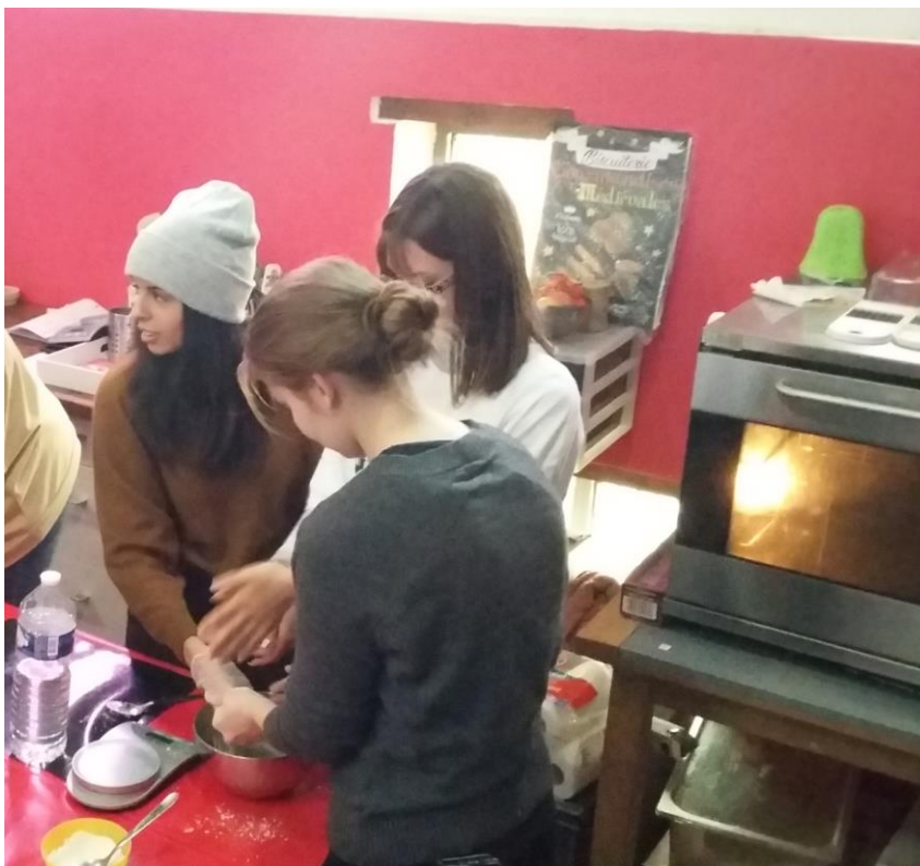
Kochkurs in Provins