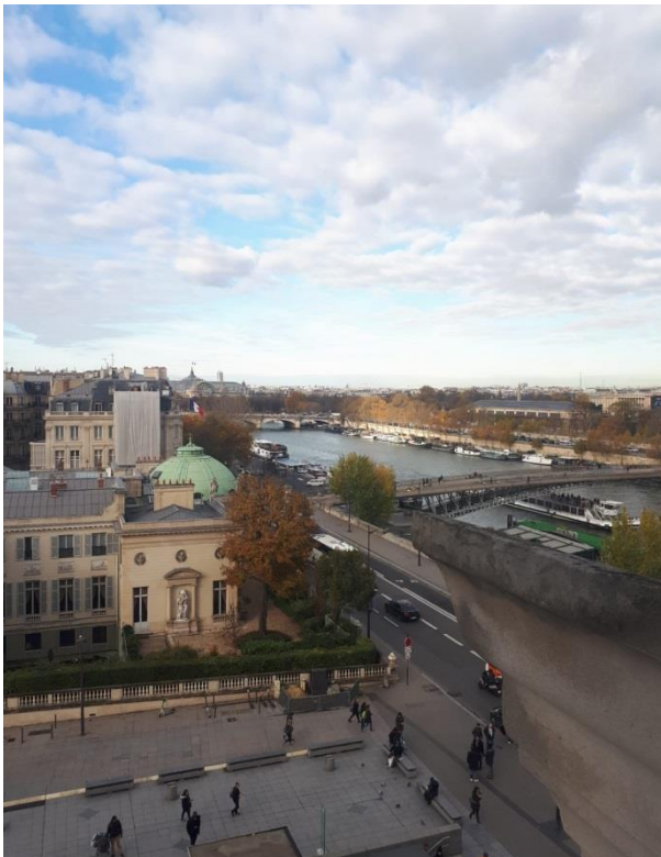
Paris von oben: Blick aus dem Musée d'Orsay