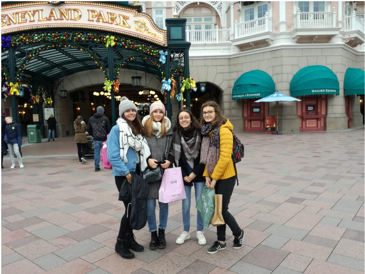
Zu Besuch im Disneyland Paris