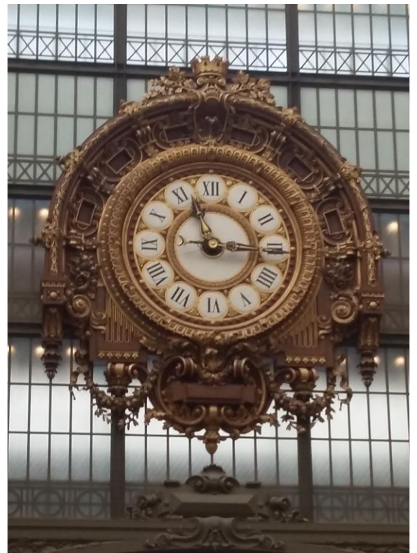
La Grande Horloge im Musée d'Orsay