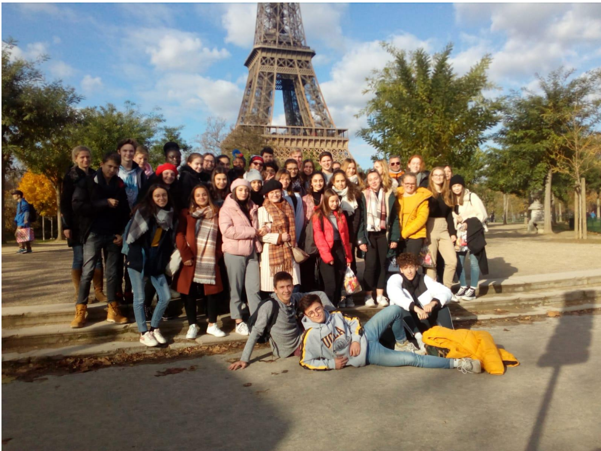
Unsere Gruppe vor dem Eiffelturm

Und zum Schluss noch einige Bildimpressionen unseres Besuches in Frankreich: